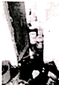
Wie sien out die buurman by Goudswaagse Jn. Die inwoners het 'n ander manier gebruik om hulle probleme te beskryf en hulle te laat weet dat hulle nie wil verhuis nie.

Die inwoners van die Agterwoud-gebied het die Volksblad-tydskrif gebruik om hulle probleme te beskryf en hulle te laat weet dat hulle nie wil verhuis nie.